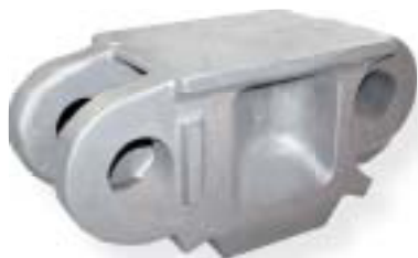
staliwo wysokomanganowe / manganese steel 600 kg