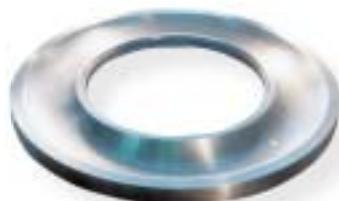
staliwo narzędziowe / tool steel 8000 kg