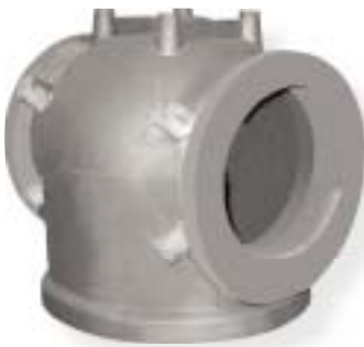
staliwo węglowe / carbon steel 6500 kg