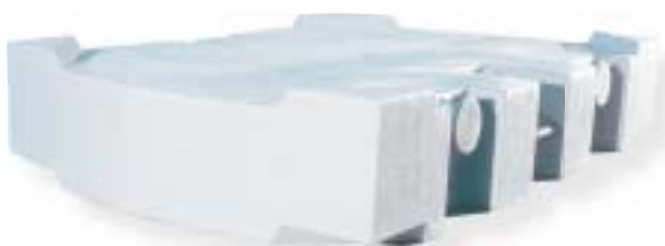
żeliwo szare / grey iron 12000 kg