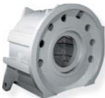
żeliwo szare / grey iron 4100 kg