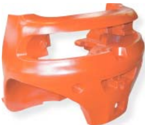
żeliwo szare / grey iron 6500 kg