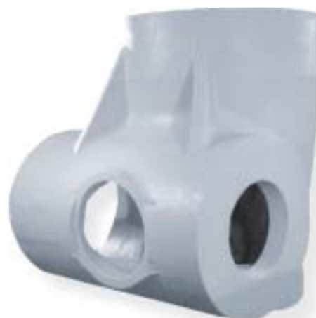
staliwo węglowe / carbon steel 12000 kg