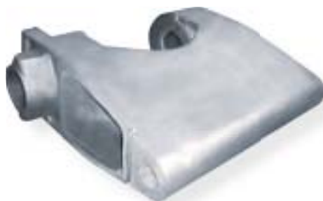
staliwo węglowe / carbon steel 4600 kg