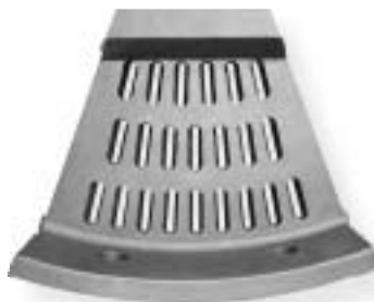
staliwo wysokomanganowe / manganese steel 500 kg