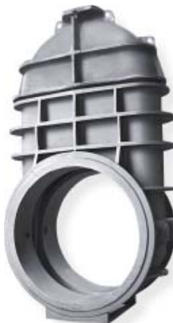
żeliwo sferoidalne / nodular iron 4500 kg