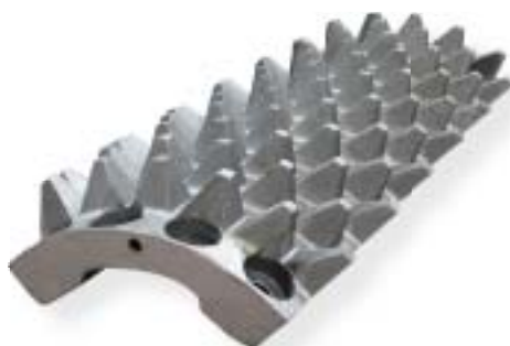
staliwo wysokomanganowe / manganese steel 1200 kg