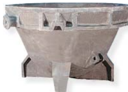
kadź / slag pot

żeliwo sferoidalne / nodular iron 14700 kg