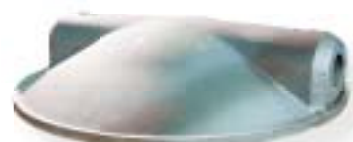
żeliwo sferoidalne / nodular iron 1200 kg