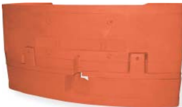
żeliwo szare / grey iron 11600 kg