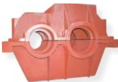
żeliwo szare / grey iron 5500 kg