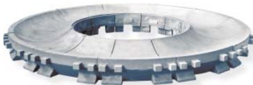
żeliwo Nihard / Nihard iron 14400 kg