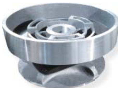
staliwo węglowe / carbon steel 10500 kg