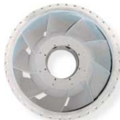
żeliwo szare / grey iron 6500 kg