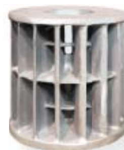
żeliwo sferoidalne / nodular iron 1000 kg