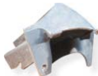
staliwo wysokomanganowe / manganese steel 250 kg