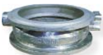
żeliwo sferoidalne / nodular iron 2800 kg