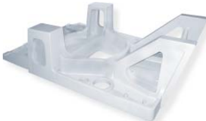
żeliwo sferoidalne / nodular iron 12300 kg