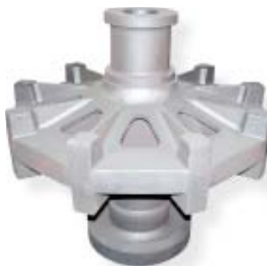
staliwo wysokostopowe / high alloy steel 5200 kg