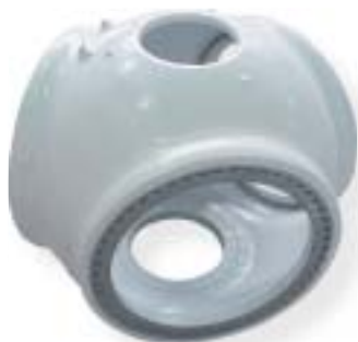
żeliwo sferoidalne / nodular iron 7600 kg