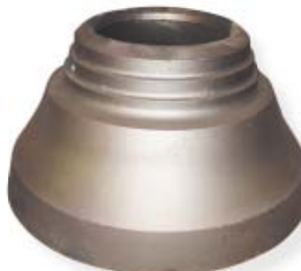
staliwo wysokomanganowe / manganese steel 4500 kg