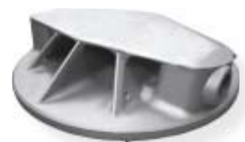
żeliwo sferoidalne / nodular iron 2900 kg