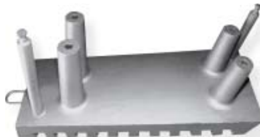
chłodnica płytowa / cooling stove

żeliwo sferoidalne / nodular iron 2900 kg