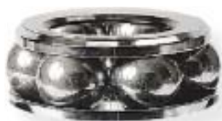
staliwo narzędziowe / tool steel 27000 kg/kpl