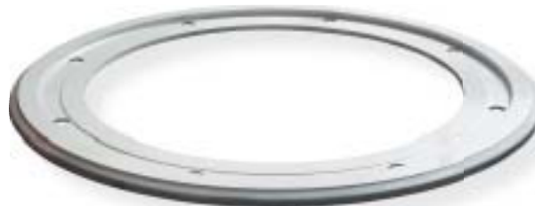
żeliwo sferoidalne / nodular iron 1300 kg