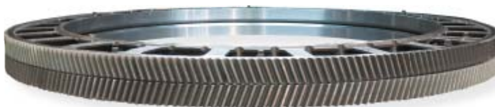
staliwo niskostopowe / low alloy steel 32000 kg/kpl