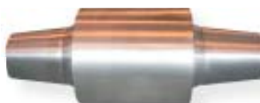
walec / roller

żeliwo sferoidalne / nodular iron 1100 kg